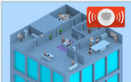
Emite mensajes de alerta de forma pregrabada o directamente por micrófonos.