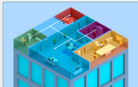
Segmenta zonas para entregar distintos mensajes.