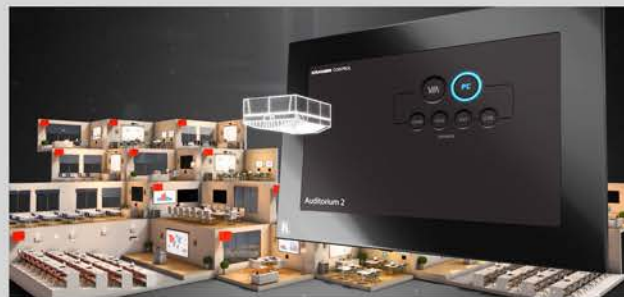
Configuración 100% adaptada al cliente.