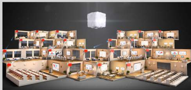
Infraestructura sencilla y escalable.